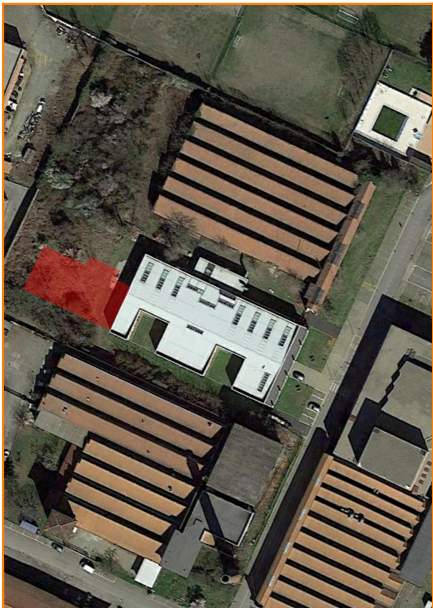
STRALCIO - FOTO SATELLITARE ■ AMPLIAMENTO IN PROGETTO