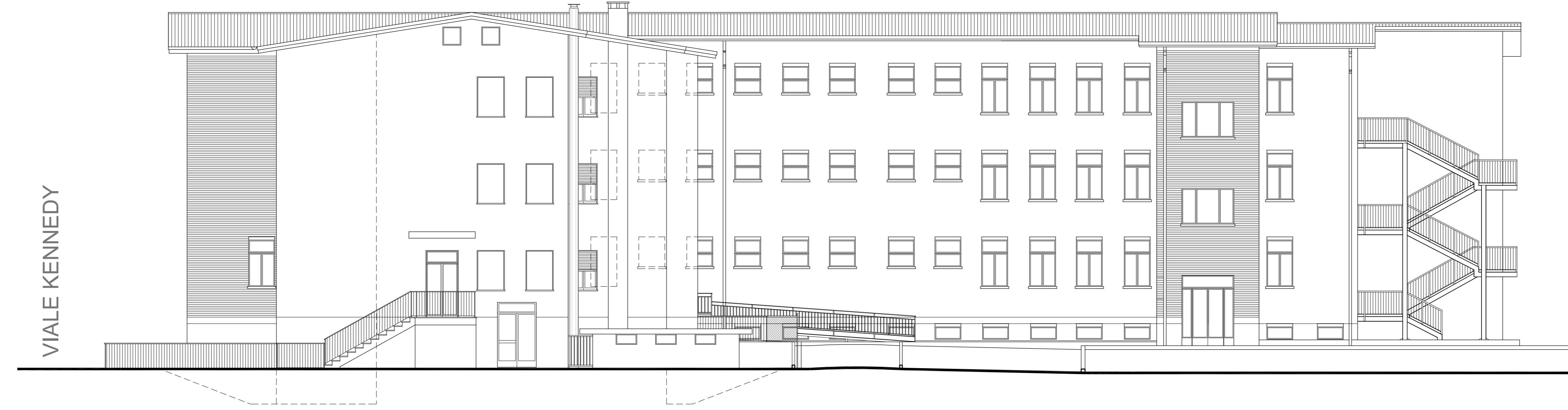
PROSPETTO SCUOLA SECONDARIA LATO NORD Scala 1:100