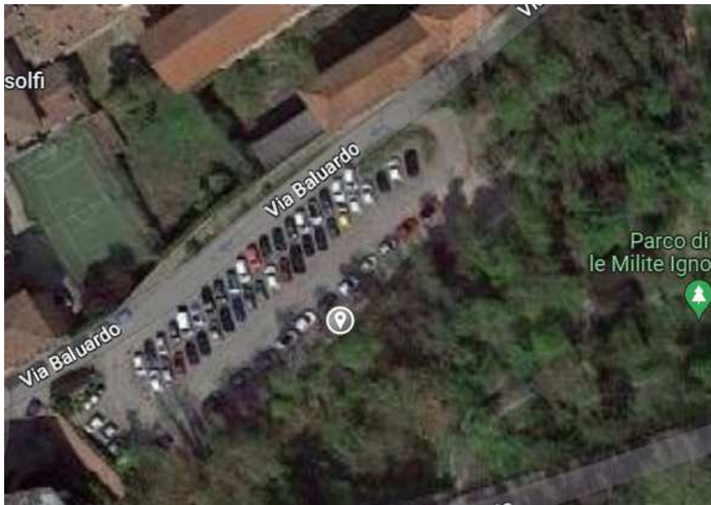
P1-Sito di indagine

Le indagini, allegate allo studio geologico, hanno compreso oltre al rilevamento geologico e geomorfologico di superficie, l'esecuzione di n.1 indagine sismica di tipo MASW, n.2 prove penetrometriche dinamiche ( p. pesante ) e n.3 prove penetrometriche dinamiche ( p. leggero ).