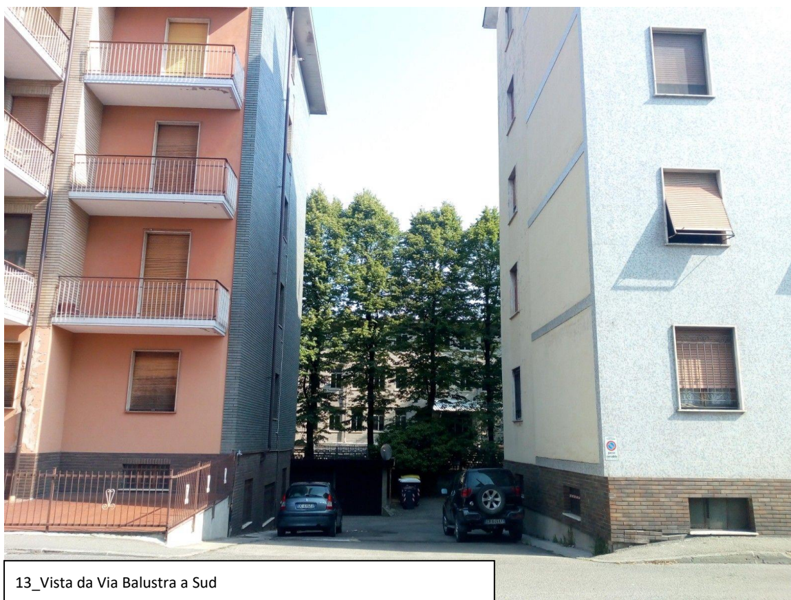
13_ Vista da Via Balustra a Sud