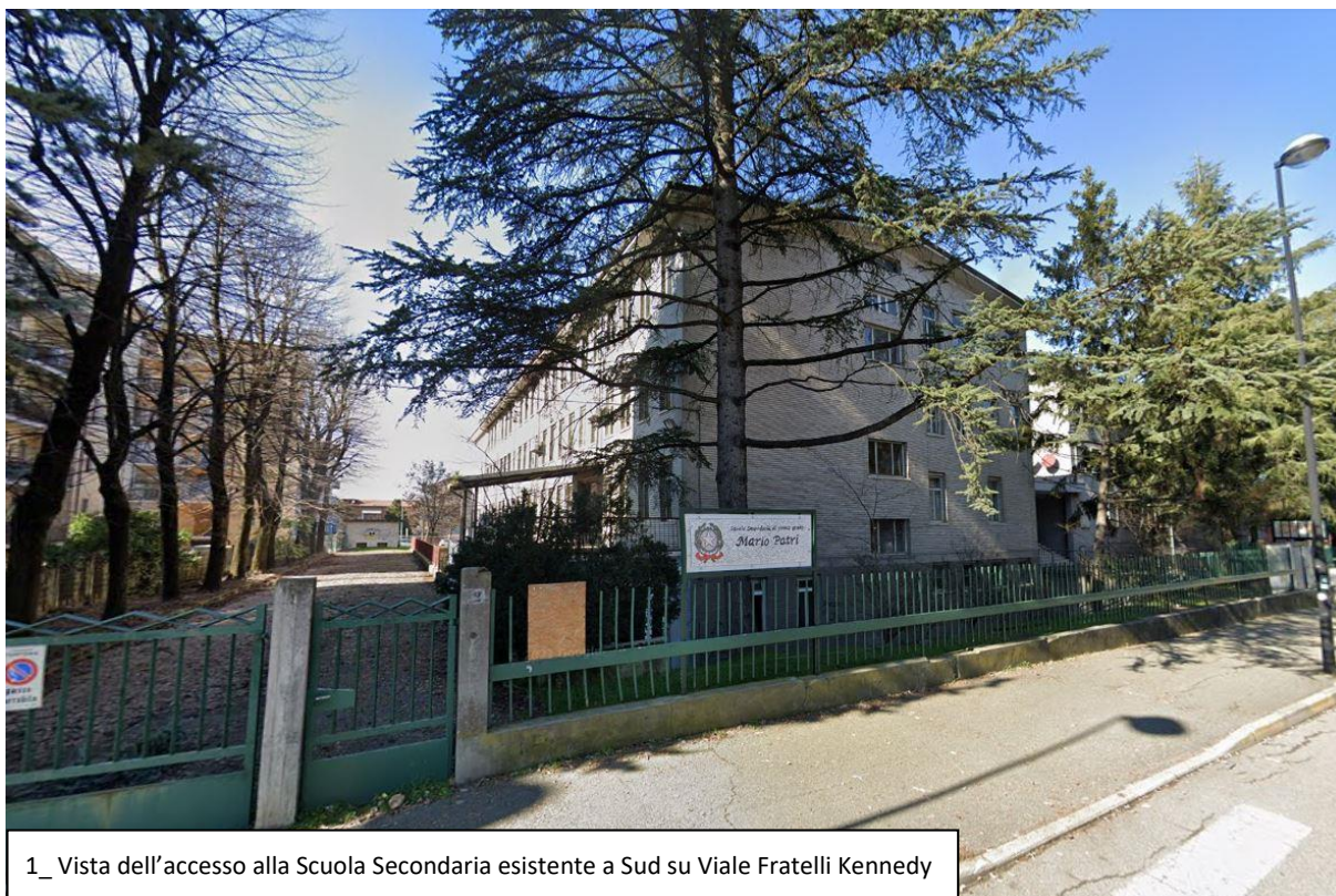
1_ Vista dell'accesso alla Scuola Secondaria esistente a Sud su Viale Fratelli Kennedy