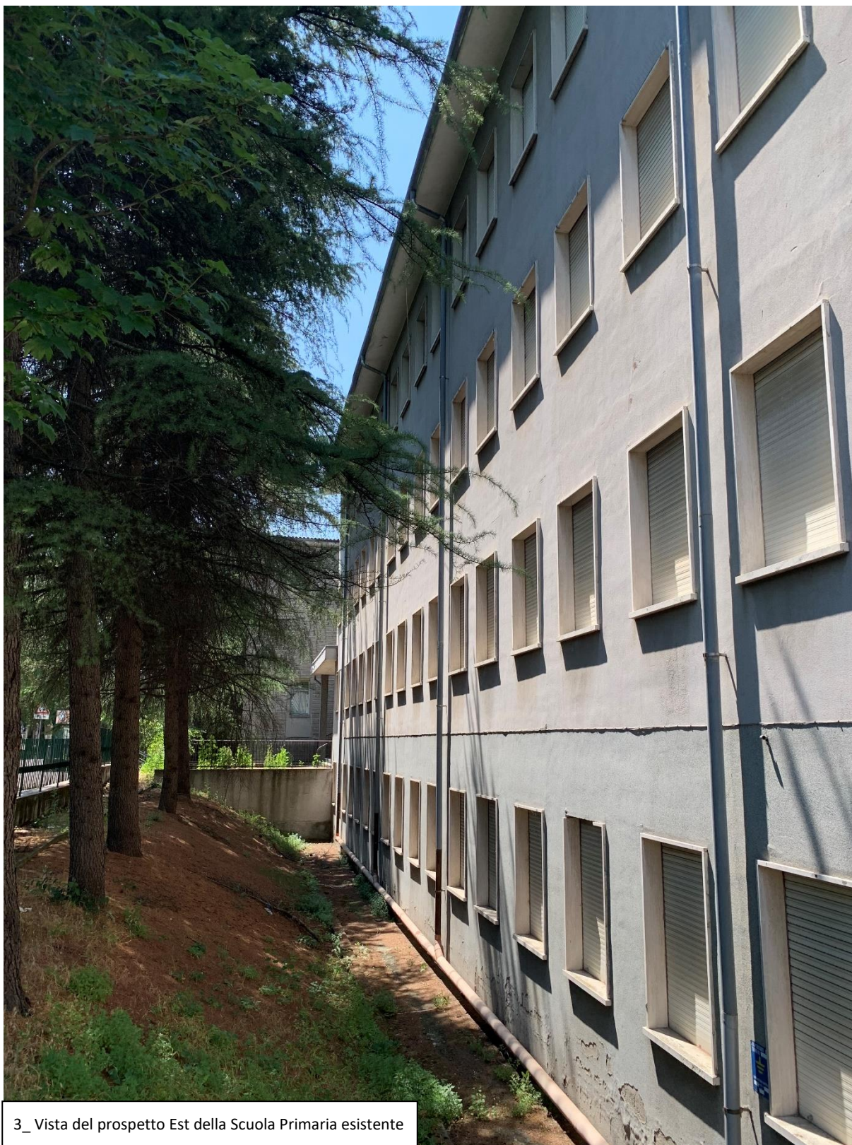
3_ Vista del prospetto Est della Scuola Primaria esistente