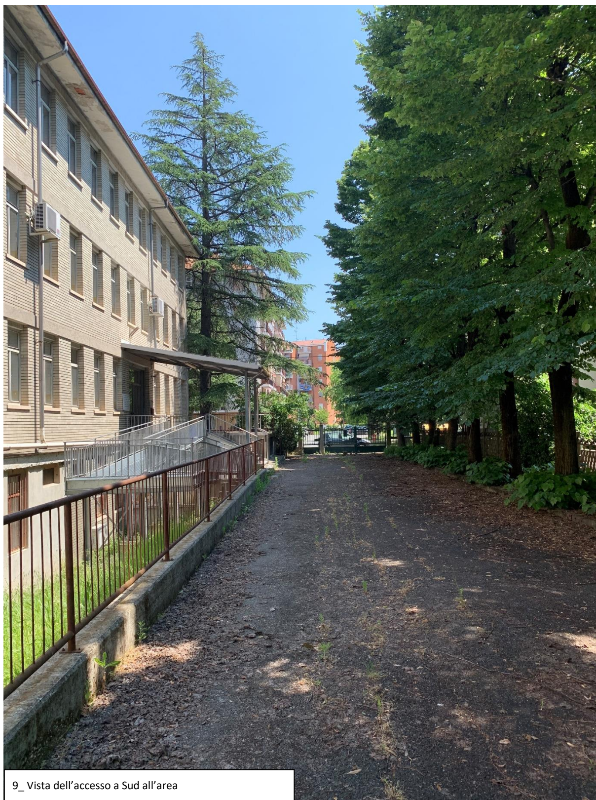
9_ Vista dell'accesso a Sud all'area