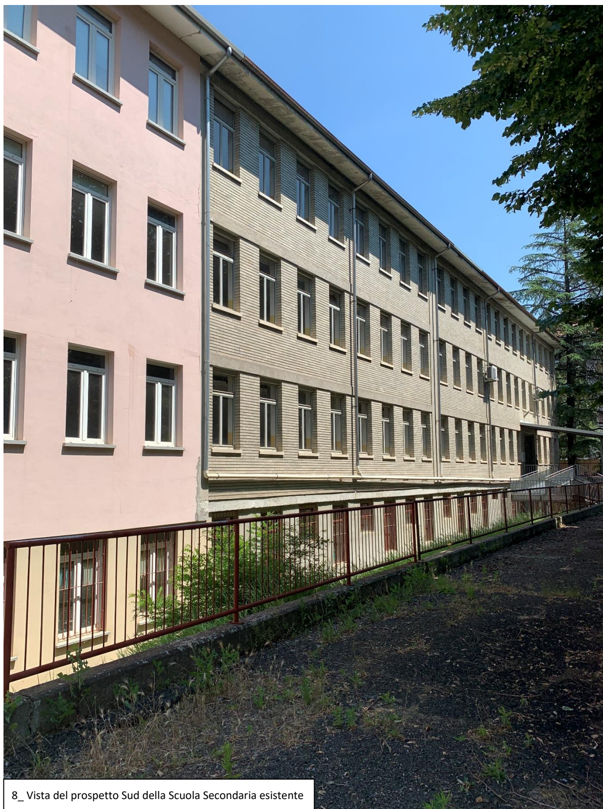
8_ Vista del prospetto Sud della Scuola Secondaria esistente