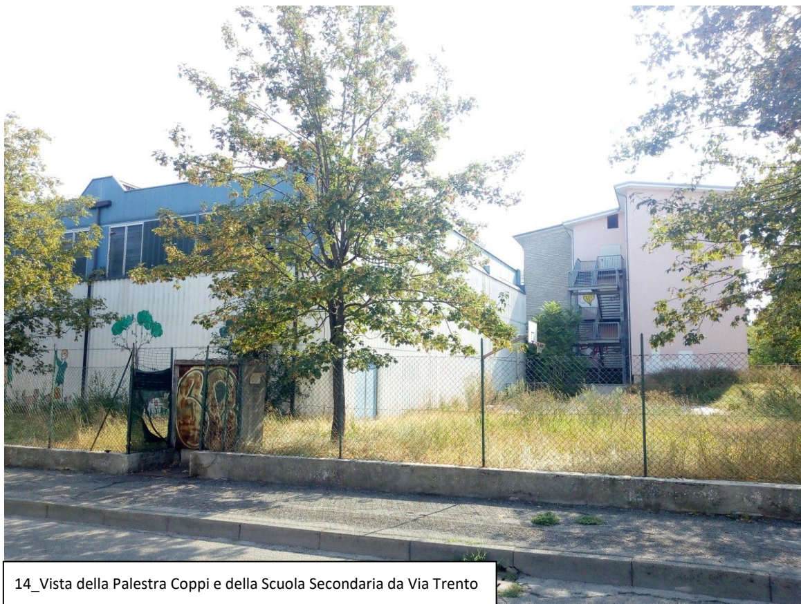
14_Vista della Palestra Coppi e della Scuola Secondaria da Via Trento