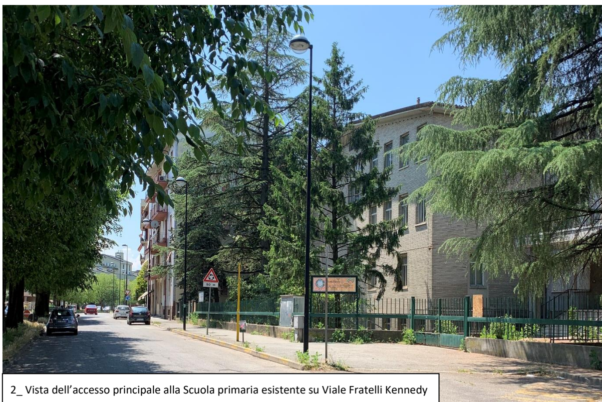
2_ Vista dell'accesso principale alla Scuola primaria esistente su Viale Fratelli Kennedy