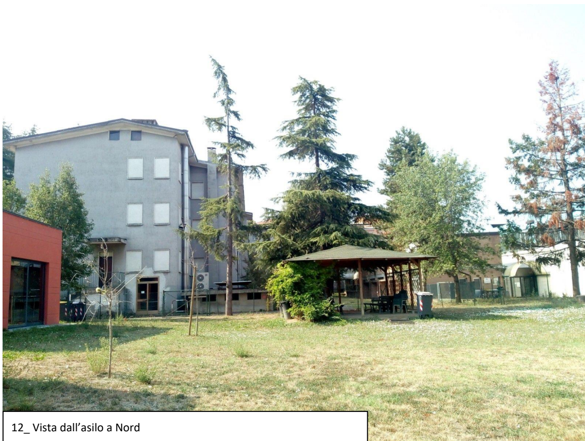
12_ Vista dall'asilo a Nord