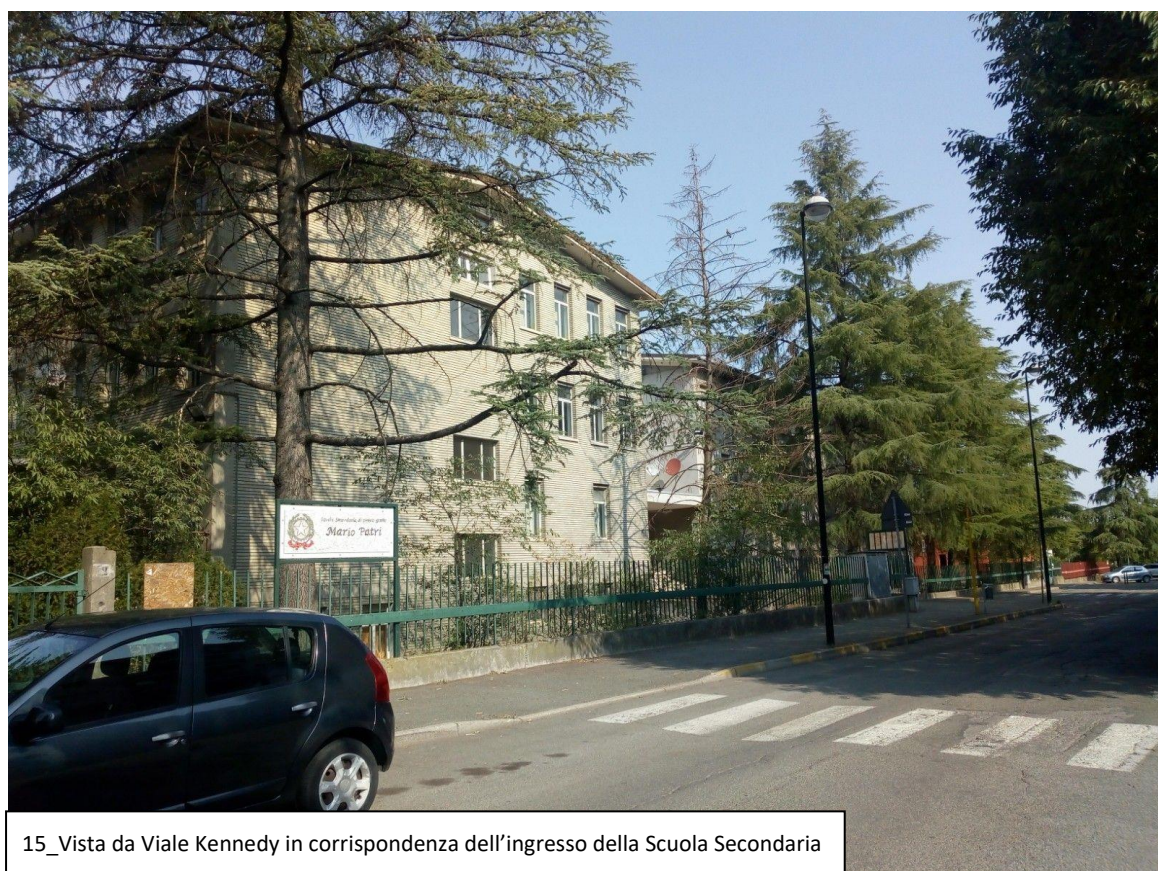
15_Vista da Viale Kennedy in corrispondenza dell'ingresso della Scuola Secondaria